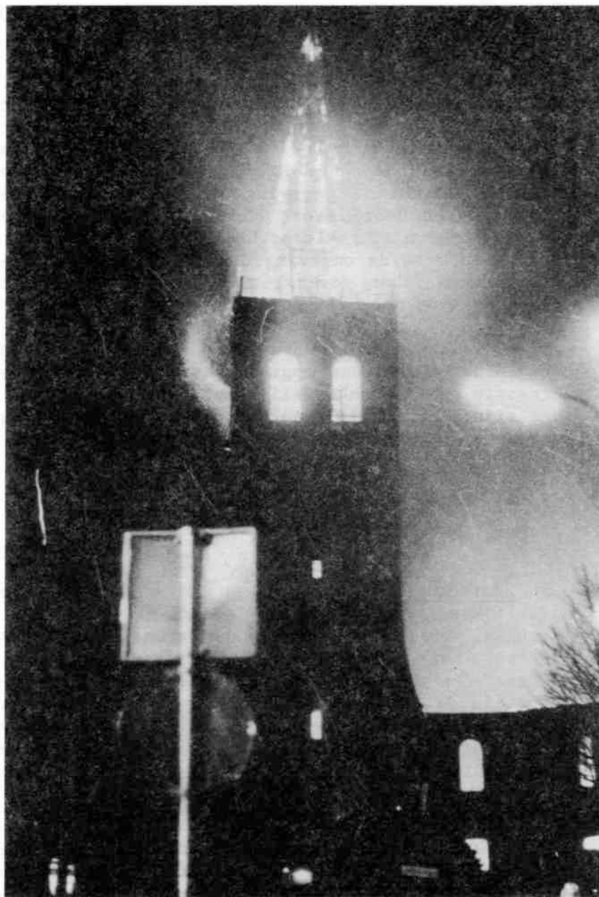
- Brand Grote Kerk 1971, foto C. VAN AGGELEN