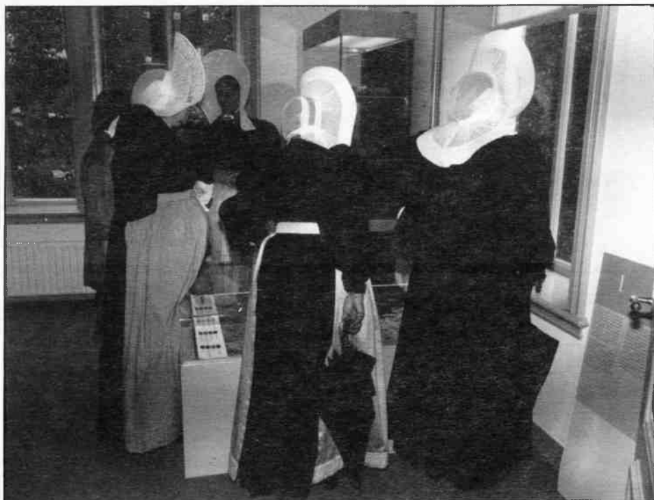
Aandacht voor het buitengebeuren vanuit het Goois Museum van vrouwen in Huizer klederdracht.