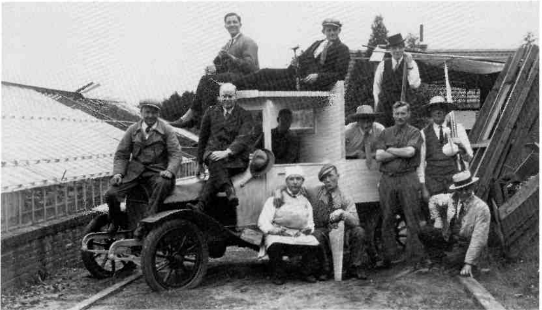
Architect Jan Duiker op de motorkap zonder hoed bij de bouw van de tuinderij bij Zonnestraatl temidden van de werklieven.