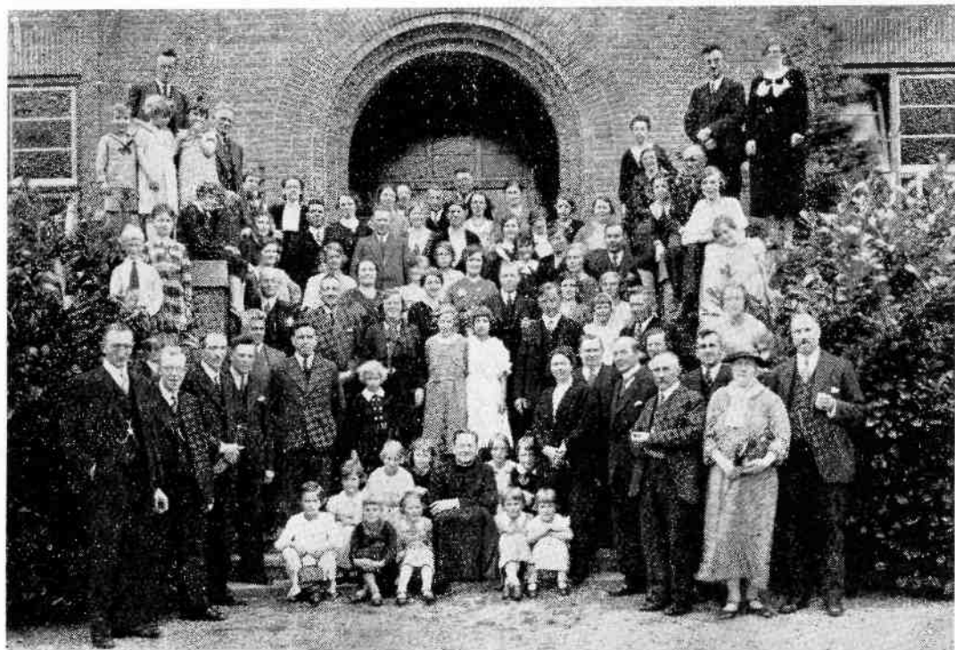
Zondag 15 september 1935. Reünie van de betrokkenen bij de brand bij Pater Buis in het missiehuis te Soesterberg (foto uit een Goois nieuwsblad d.d. 18 september 1935. Arch. Provinciaal SVD, Teteringen).