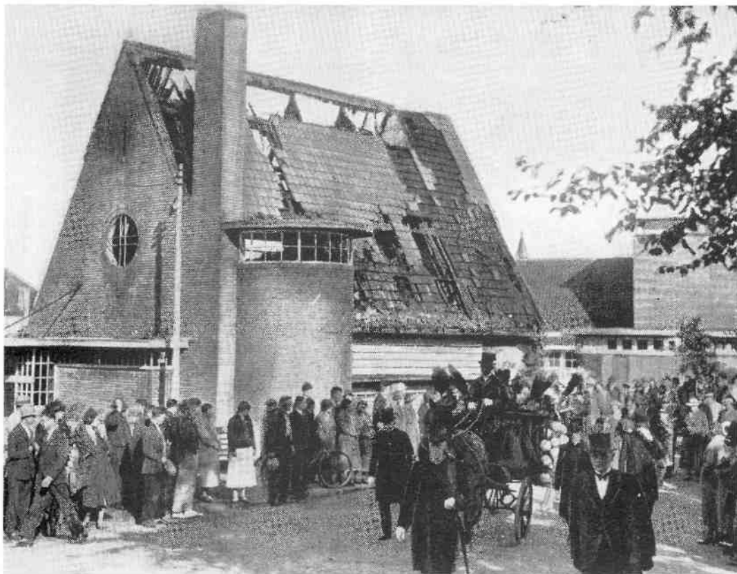
De rouwstoet met het stoffelijk overschot van het eerste slachtoffer, de 7-jarige Beppie Hilhorst, passeert hier het verwoeste verenigingsgebouw (foto: Maasbode, 28 september 1934. Archief Provinciaal SVD, Teteringen).

Het aantal dodelijke slachtoffers bleef dus tot drie beperkt. Sommige kinderen hebben hun verdere leven zichtbaar lidtekens overgehou-