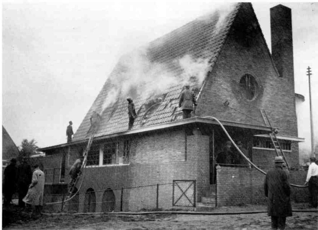
De bluswerkzaamheden aan de achterzijde van het gebouw. Links achter de vluchtdeur, die – tegen de voorschriften in – bleek te zijn afgesloten (foto: Streekarchief, Hilversum).

Het vuur braakte intussen uit het dak van het gebouw. Velen kwamen op de brand af. De totaal overstuur geraakte meisjes waren door de buurt uitgezwermd. Toegestroomde ouders konden hun dochter niet vinden en raakten ook in paniek. De inmiddels gearriveerde brandweer onder leiding van brandmeester van Dam ging het vuur te lijf. Met hulp van een ladder werd een gat in het dak gehakt en hierna kreeg men de brand langzaam onder controle. Brandweerman van Raaijen werd door een vallende dakpan getroffen en liep een slagaderlijke bloeding op. Terwijl gewonde kinderen werden afgevoerd naar ziekenhuizen ontstond er een grote menigte. Daaronder bevonden zich burgemeester Lambooj, commissaris van Beusekom van de Hilversumse politie en de directeur publieke werken, tevens commandant brandweer, ir Groote. Toen men na een uur de brand meester was