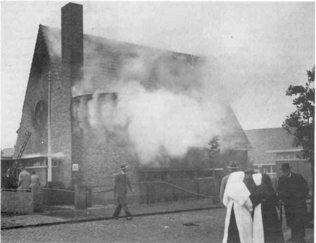
De filmbrand van 24 september 1934. Een foto van de voorzijde van het gebouw. De brandweer is bezig met de bluswerkzaamheden. De slachtoffers zijn dan al afgevoerd.

Er kwamen nog meer buurtbewoners op het tumult en de al uitbrakende rookwolken af. Zij zagen kans de hooggelegen ramen in te slaan en de kinderen daardoor naar buiten te trekken.