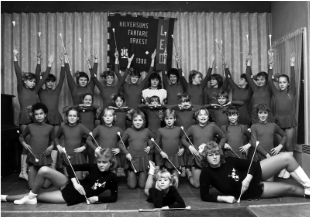
Tijdens de opening van het nieuwe clubgebouw aan de De Kupstraat in 1990 gaven ook de majorettes acte de présence.

'Honderd jaar Leo' wordt gepresenteerd op de jubileumreceptie op 29 januari 2000. De oplage is vijfhonderd genummerde exemplaren. Het boek (genaaid gebonden, harde kaft, 80 bladzijden) kost vijftwintig gulden en is te bestellen bij de vereniging via tel. nr. 5313309 of 5412740.