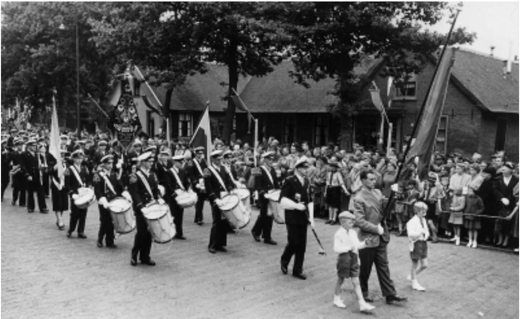
Optreden van de drumband in 1953. Met zelfgemaakte trommen!