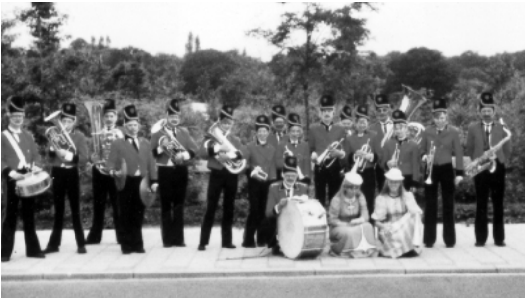
De Hilversumse muzikanten speelden mee in de populaire tv-serie 'Dagboek van een herdershond'.