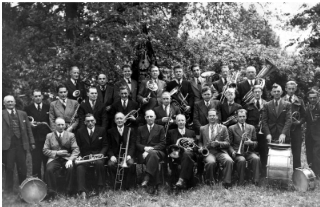
De 'Leo' in de jaren dertig.

Het R.K. Fanfarekorps Leo was op 24 januari 1900 opgericht, op initiatief van een achttal Hilversummers. Notaris Luycks schonk twaalf koperinstrumenten en twee trommels. Het muziekkorps, onderafdeling van de R.K. Werkliedenvereniging,