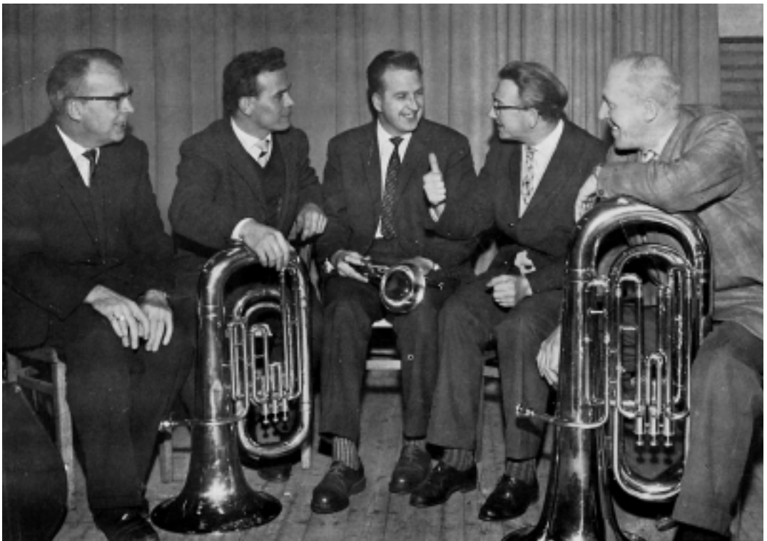
'De boeren hebben naar hartelust geblazen': De boerenkapel maakt reclame voor de nieuwe trekkerbanden van Tyresoles, begin jaren vijftig.