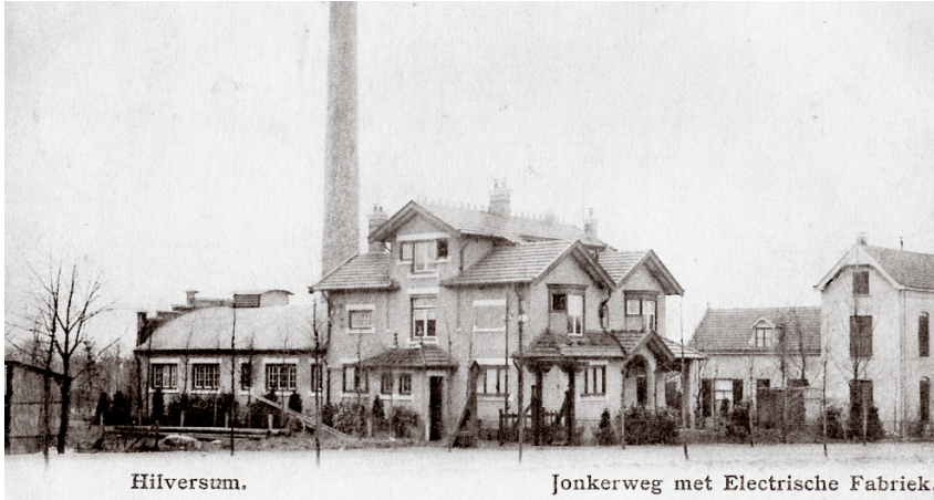
De elektriciteitscentrale aan de Jonkerweg 13 rond 1905. (coll. Streekarchief)

menten. Hoe het gebouw eruit ziet, ziet u op de foto. De functie die het monument had was het opwekken en leveren van energie, bijvoorbeeld voor het verlichten van huizen.