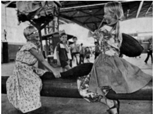
Twee bezoekerkes aan de Expo-instituif van 1969, ontwikkeld in een heftig kussen-gevecht.

Burgemeester Boot reikte op Jeugdland 1967 een 'verblijfsvergunning' uit aan de 'Koningin van de Pirinella's'.