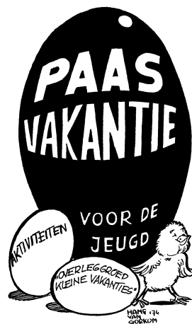
Tekening van Hans van Gorcom voor een advertentie voor de paasactiviteiten '74.

De daaropvolgende jaren ontwikkelt het Hilversumse Kindervakantiewerk zich verder. De belangrijkste veranderingen op een rijtje. Het Bonanzadorp wordt in 1970 een zelfstandig onderdeel (als Evenementenweek), en vindt onderdak in de 'Bijlardhal' aan de Prins Bernhardstraat. Een jaar later zijn het Bonanzadorp en het Jeugdcircus in de Feesthal aan de Vaartweg. Het circus Fakantia trekt in 1972 voor het eerst door Hilversum, om in vijf verschillende wijken telkens twee voorstellingen te geven. Het Matawit-terrein is vervolgens (vanaf '73) de locatie voor de Evenementenweek. In 1974 wordt de Expo-instuif –