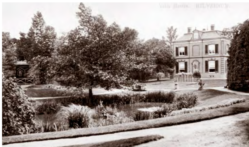
Villa Hestia op een Ansichtkaart in het begin van de 20e eeuw