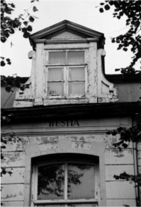
Aan het eind van de jaren negentig was de villa verlaten en verwaarloosd.