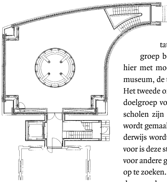
Plattegrond van het nieuwgebouwde deel van het museum, met op drie hoeken ramen en in de vierde hoek het trappenhuis.

De benedenverdieping bestaat uit drie onderdelen. In één hoek kunnen maximaal 40 personen een presentatie te zien krijgen of een introductie aanhoren. Een groep bezoekers die per bus komt of een schoolgroep wordt hier met moderne hulpmiddelen adequaat geïnformeerd over het museum, de tentoonstellingen of een ander onderwerp.