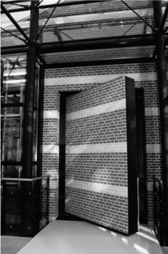
Een Harry Potter-achtig grapje van de architect: door een draaibare muur kan men vanuit de Oude Raadszaal naar de eerste verdieping van de nieuwbouw lopen.

rogramma langs de belangrijke architectuur in Hilversum, de activiteiten op de Kerkbrink, alle activiteiten in vele samenwerkingsprojecten en nog veel meer. Het beste is het om het met eigen ogen te aanschouwen en deel te nemen aan de activiteiten.