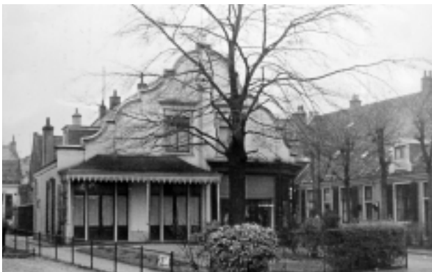
Het huis Langestaat hoek Zon- en Maanstraat. Johan Geradts zette de boekhandel van Van Cleef op deze plek voort en begon hier ook een drukkerij.

Meinouda trok na de verkoop met haar dochters bij haar zusters op de Oude Torrenstraat in en verhuisde later naar de Langestraat, waar ze in 1875 overleed.