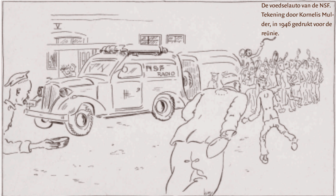
De voedselauto van de NSF. Tekening door Kornelis Mulder, in 1946 gedrukt voor de reünie.

TER HERINNERING AAN DE BIJENKOMST TE HILVERSUM OP 6 APRIL 1946 VAN DE N.S.F.-ERS VAN HET P.D.A. KAMP TE AMERSFOORT.