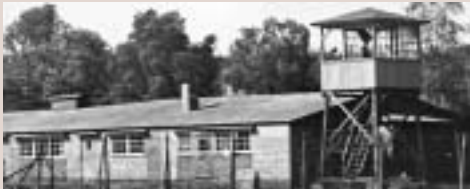
Barak en wachttoren in Kamp Amersfoort.

Het 'NSF-' of 'Radiocommando' werd in 1943 opgericht en ondergebracht in Block V. Deze 'NSF-barak' lag naast de 'Werkstätten-barak' in het gevangenenkamp. Een klein deel van Block VI was eveneens ingericht voor de NSF. Meer dan honderd gevangenen waren in drie ploegen voor de NSF aan het werk. De werkzaamheden bestonden uit het in elkaar zetten en verzendklaar maken van radiokastjes en onderdelen. Het werk aan de lopende band was licht en gemakkelijk.