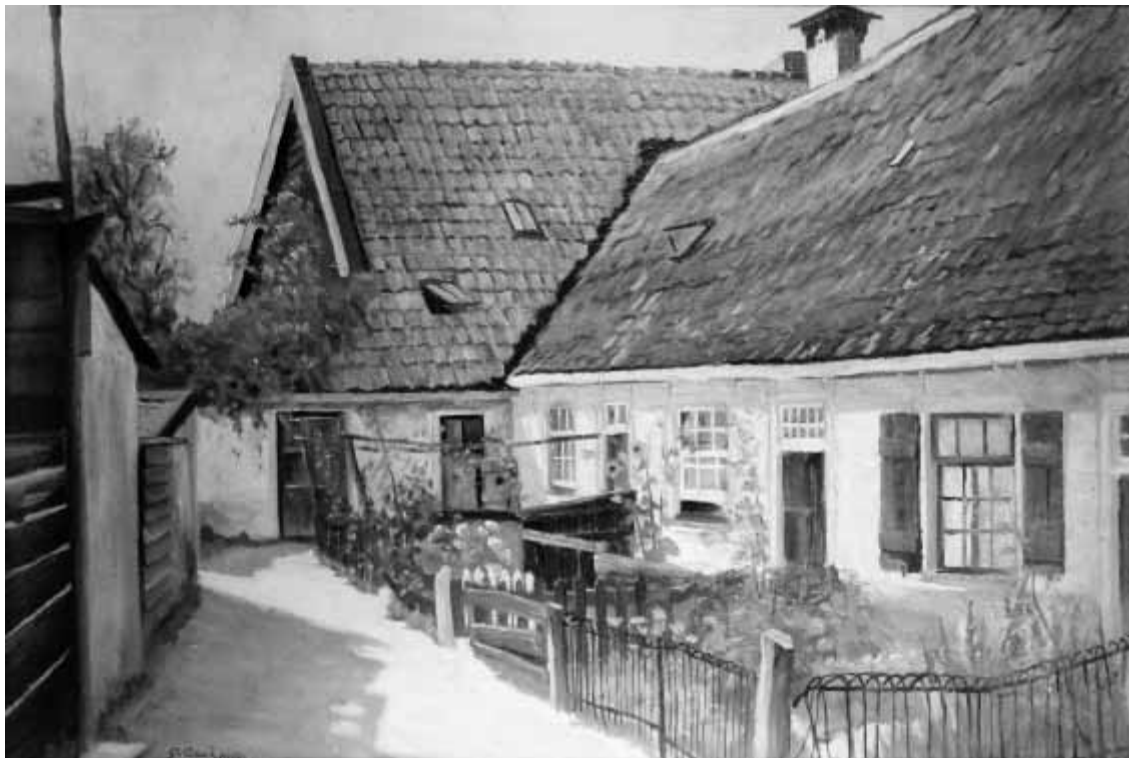
Het schilderij van G. van Schaik: Oude Torenstraat 13 t/m 17.