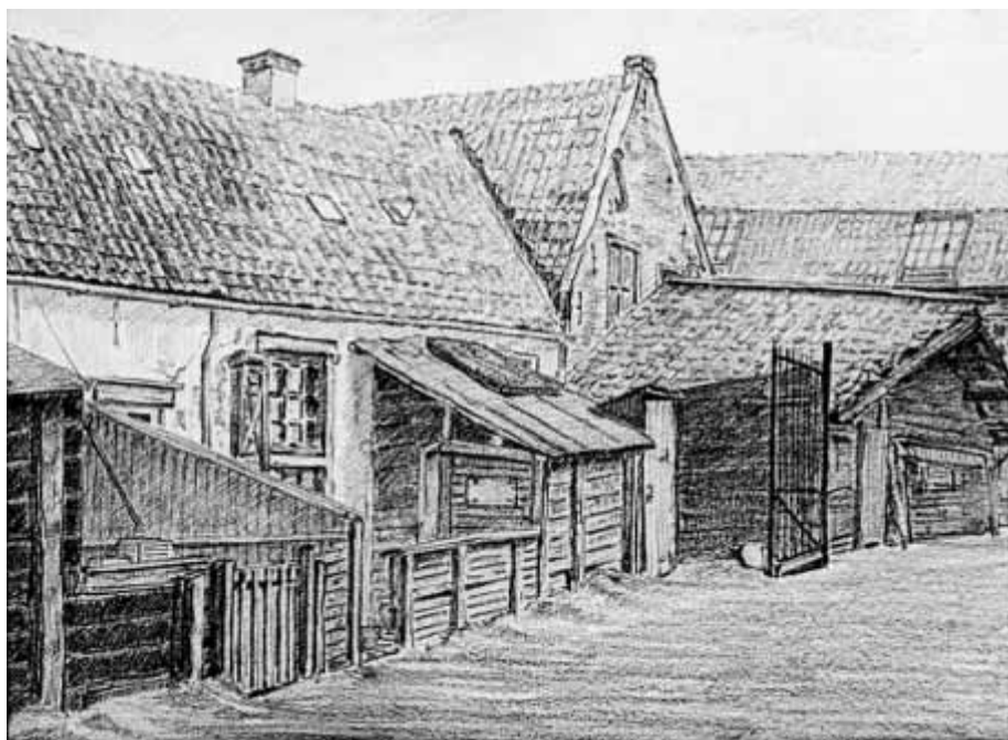
Tekening van de Oude Torenstraat uit 1942, van Hans Almekinders. (col. Museum Hilversum)