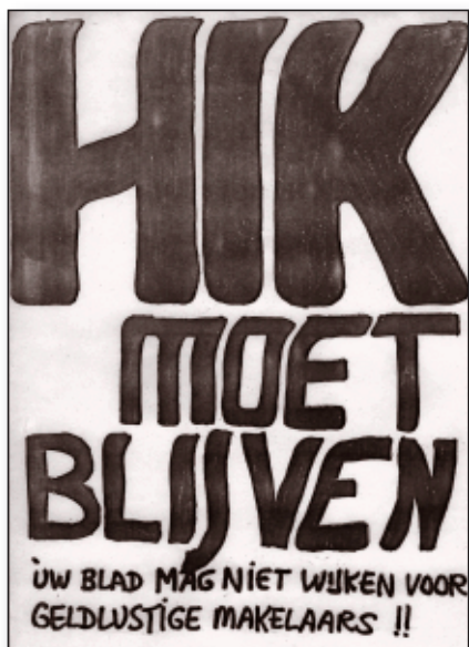
Actieaffiche najaar 1975.