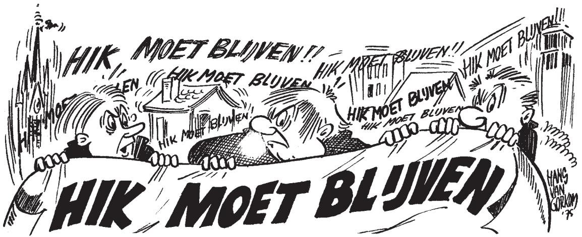
Een protesttekening van Hans van Gorkom in HIK nr. 98, een van de laatste HIK's die in de Gooi- en Eembode verschenen.

Raadhuis) op de Kerkbrink. Na de plechtige kranslegging, die vergezeld ging van rouwmuziek, veranderde de bijeenkomst in een speelse manifestatie. Na het zingen van liederen als Het is de schuld van het kapitaal en We shall overcome volgde een demonstratieve optocht naar de kantoren van de Gooi- en Eembode aan de Schoutenstraat en de 's-Gravelandseweg. Stapels Gooi- en Eembodes werden door de brievenbus 'terugbezorgd'. Terug op de Kerkbrink werden voor de deur van de HIK-redactie enkele exemplaren van het huis-aan-huisblad in brand gestoken. Een vlammend protest, schreef de krant.