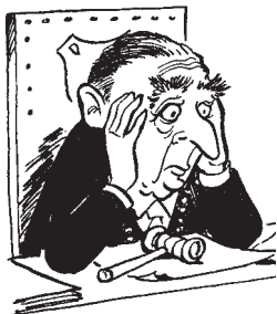
Burgemeester P.J. Platteel. HIK 26 maart 1974.

lekker zit met de vrije meningsuiting. Ook niet op kleine, plaatselijke schaal.