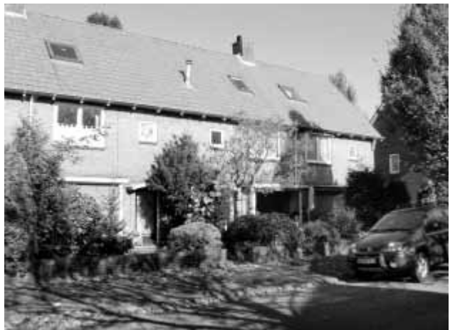
Pieter Postlaan 40.