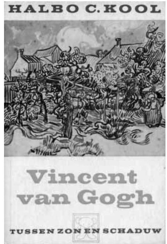
Omslag van de pocket-editie van Tussen zon en schaduw .