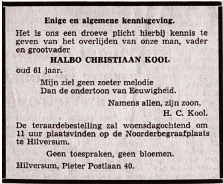
De overlijdensadvertentie in De Gooi- en Eemlander van 1 juni 1968.