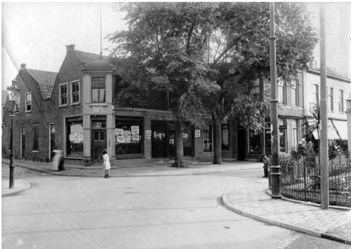
De oude bebouwing op de andere hoek van de Zeedijk en de Kerkstraat.