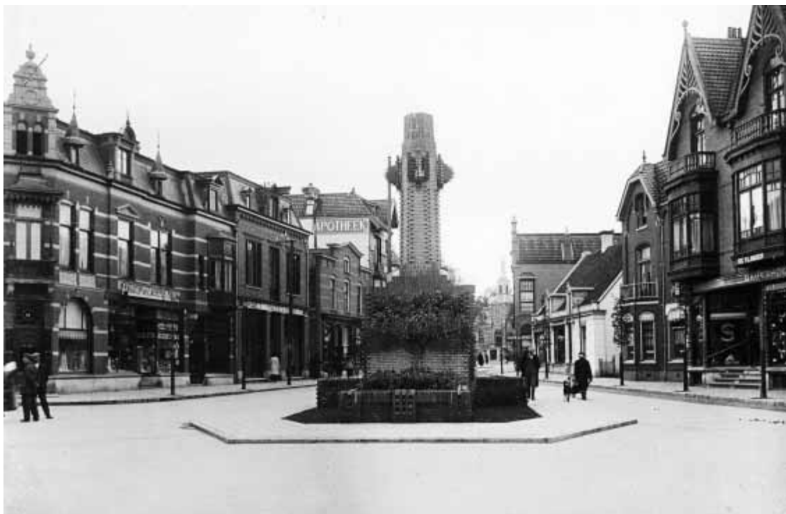
Foto van de Kerkstraat richting Kerkbrink na de herinrichting van het plein. De fontein van Dudok uit 1917 (gesloopt in 1950) is prominent aanwezig. Het pand links op de hoek van voormalige Koornstraat, nu juwelier Siebel, is gedeeltelijk intact gebleven.

Het plein in de Kerkstraat. Het postkantoor werd in 1960 gesloopt en vervangen door het huidige pand van C&A naar een ontwerp van Dudok. Aan de apotheek rechts herinnert alleen nog het woord apotheek op de zijgevel van het gebouw. Het pand links van drogist De Vries is gesloopt en vervangen door het huidige gebouw, waar Rutgers, La Ligna, Prénatal en Simon Lévelt gevestigd zijn.