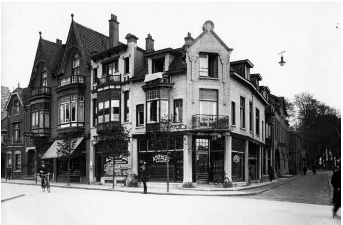
In een tijdsbestek van zes jaar verrezen de nieuwe panden op de hoek Kerkstraat/Schoutenstraat. Het linker, nummer 94, nu Strating, is het oudste. Architect Emons ontwierp het in 1905 voor het kassierskantoor Van Leeuwen. Daarnaast werd drie jaar later de twee winkel-woonhuizen van Denekamp gebouwd. Renou zit daar bijna vanaf het begin. Het gebouw op de hoek stamt uit 1909 en is ontworpen door Van Heusden. Het tussenliggende pand, nu Van Drimmelen, werd in 1911 door Slot getekend. Het plein voor C&A was ten tijde van deze opname al heringericht met de fontein.