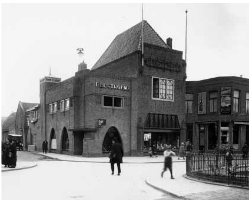
Dezelfde hoek na de sloop en nieuwbouw. Het hoge pand werd gebouwd om een kruidenierswinkel van Albert Heijn te huisvesten. Rechts daarvan huist de behangerij/stoffeerderij fa. H.L. Greeve, die daar later een grote meubelwinkel zou laten bouwen. Op de hoek is klaarblijkelijk een stofzuigerwinkel van Electrolux, een Hilversums fabrikaat. Hier is nu al jaren de winkel van Benetton.