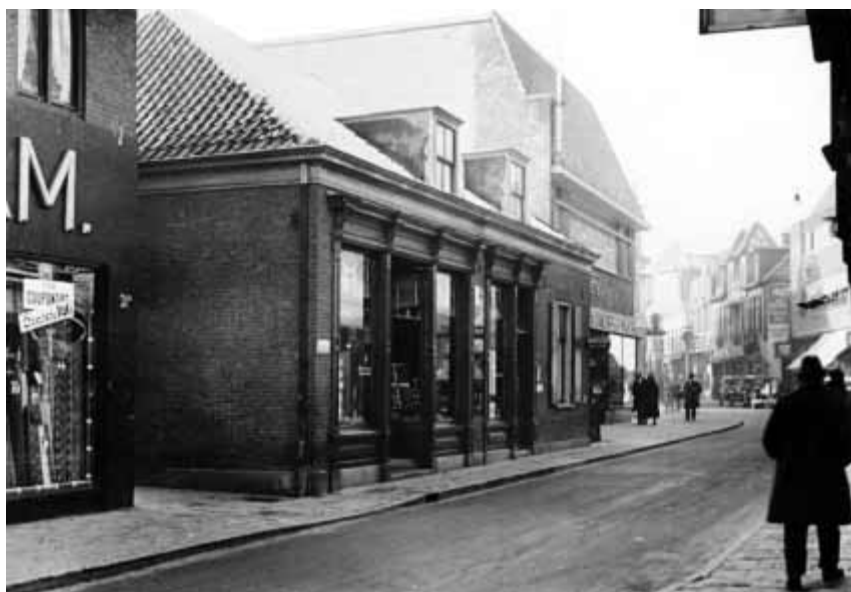
Foto van de Kerkstraat ter hoogte van de Zeedijk. Het hoge pand links is de huidige Hema. Het pand in het midden is gesloopt.

Deze foto van de hoek van Kerkstraat en de Doelen zat los in het album en dateert uit 1929 of 1930. Het winkeltje op de hoek is de 'Hygiënische roomboterinrichting De Betuwe'. Het hoge gebouw rechts op de achtergrond werd in 1927 gebouwd voor het Leger des Heils. Het oude winkelwoonhuis op de hoek is in 1930 gesloopt en vervangen door de manufacturenwinkel van Noordman, waar nu Douglas in is gevestigd. Beide panden zijn van architect Trappenberg.