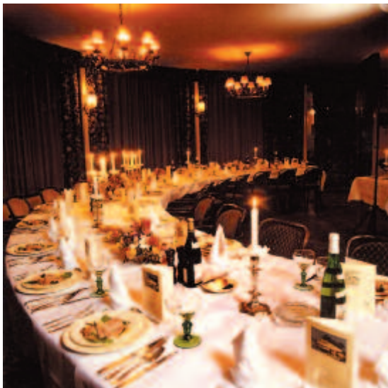
Bij kleine gezelschappen stond een koud buffet in het paviljoen zelf, maar grotere buffetten (zoals rechts) stonden in de gang. (coll. Wildschut en coll. R. Verhagen)