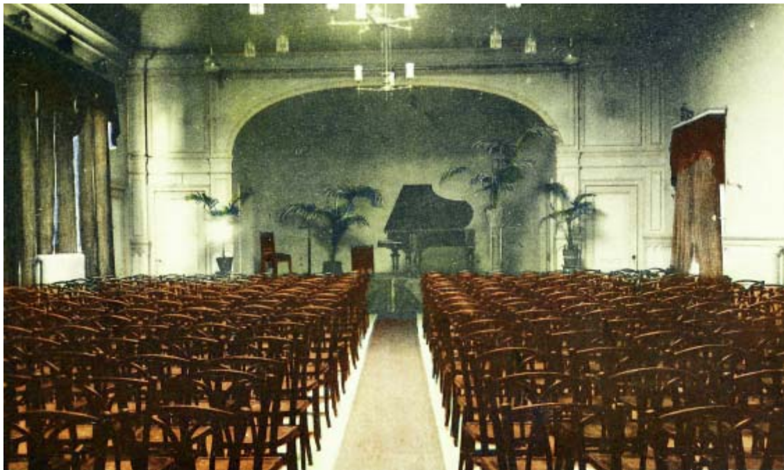
De oude toneelzaal in Het Hof van Holland, ingekleurde prentbriefkaart uit ca. 1920.

Echter aan het begin van de nieuwe eeuw viel de verkoop van het aantal abonnementen tegen. Het jaar 1902 moest voor het eerst met verlies worden afgesloten, zij het met slechts f14,26. Voor het seizoen 1903-1904 was zo weinig belangstelling dat sluiting onver-