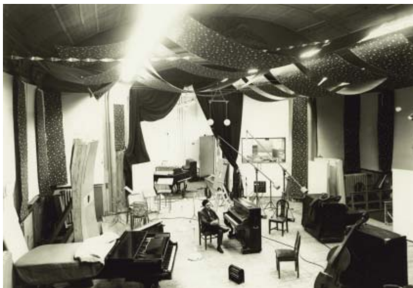
Interieur van de Phonogramstudio in het Concertgebouw, 1963.