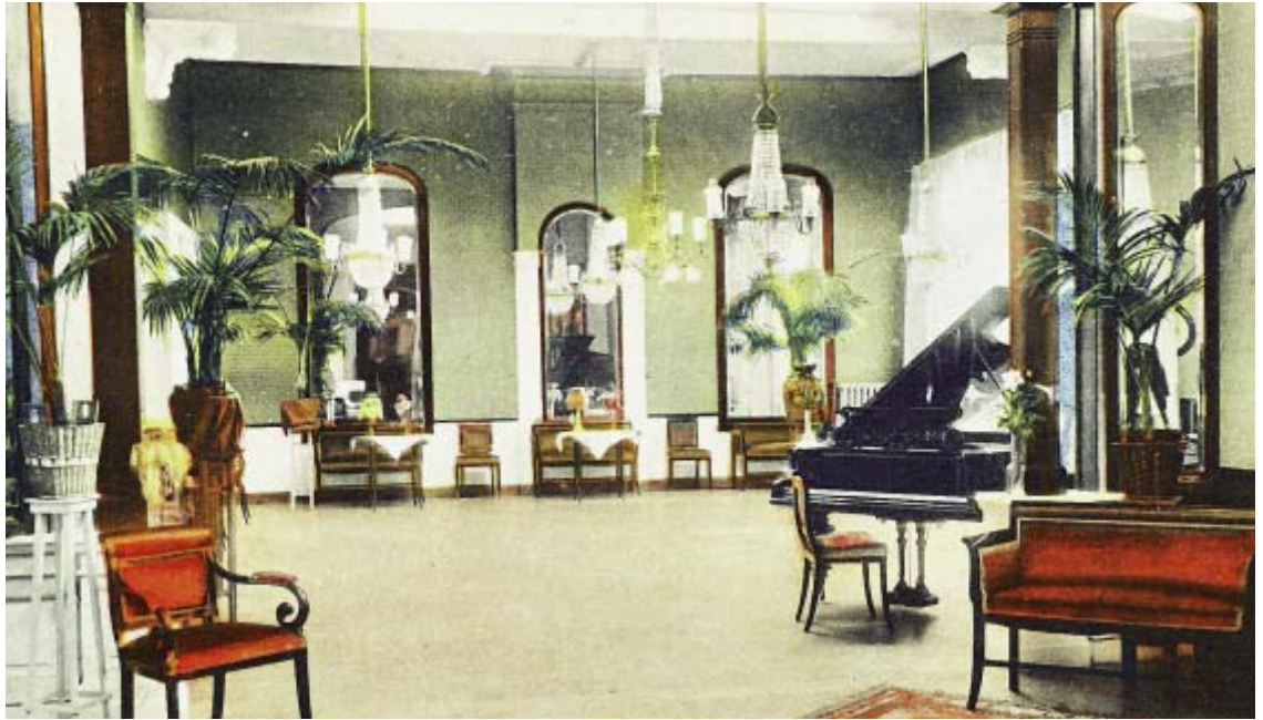
Foyer en balzaal bij de concertzaal in Het Hof van Holland, ingekleurde prentbriefkaart uit ca. 1920.

C. Andriessen, waarbij een gedicht werd gezongen van J.F. Hintzen, op muziek gezet door C. Andriessen Jr. De Gooi- en Eemlander gaf een uitvoerige beschrijving: de zaal was keurig ingericht en goed geventileerd en had 308 eersterangs- en 74 tweederangs-zitplaatsen. De vloer liep langzaam op waardoor iedereen goed zicht had op het toneel. Er was een sterk voetlicht en midden in de zaal hing een kolossale kroon. Bijzonder was dat de versiering, onder meer de decoratie op het balkon, met een nieuwe techniek was vervaardigd: het reliëf was gemaakt van papier-maché.