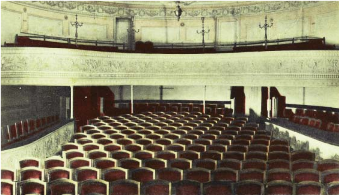
Interieur concertzaal anno 1920, ingekleurde prentbriefkaart.