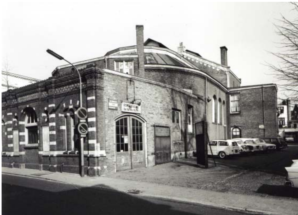
Het Concertgebouw met voorgebouw gezien vanaf de Herenstraat in 1963. Aan de rechterzijde van de voorbouw is de entreehal afgebroken. De ingangdeuren zijn opnieuw gebruikt.