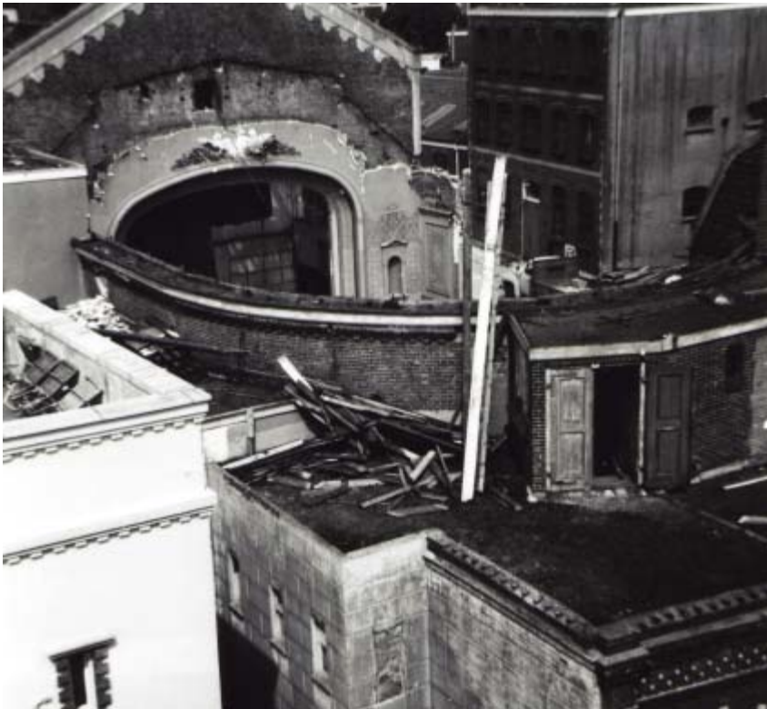
Afbraak van de opnamestudio en voormalige concertzaal. Foto van Percy Poolman uit 1964. (foto: Percy Poolman)

In 1935 kreeg het gebouw toch een omroepvereniging als gebruiker. De KRO-studio aan de Emmastraat werd verbouwd en uitgebreid, en de omroepvereniging koos het theatergebouw als tijdelijk onderkomen. De staat van het gebouw liet in die tijd te wensen over. Het gedenkboek ter gelegenheid van het vijftienvijftig jarig bestaan van de KRO maakt melding van een waar doolhof van hokjes, gangen en vertrekjes, een noodbehuizing waar iedere niet-ingewijde noodwendig op dwaalwegen ge-